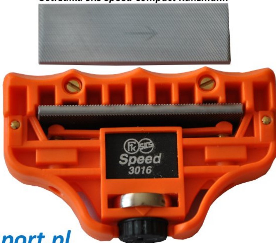
Ostrzałka SKS Speed Compact Kunzmann

Ostrzałka narciarsko-snowboardowa SKS Speed Compact model 3016 firmy Kunzmann umożliwia ostrzenie krawędzi bocznej w zakresie od 90 do 86 stopni z regulacją co 0,5 i 1 stopień oraz ostrzenie krawędzi dolnej (podwieszenie krawędzi) od 0 do 4 stopni z regulacją co 0,5 i 1 stopień. Można nią ostrzyć krawędzie nart i desek snowboardowych gdzie promień skrętu wynosi 11 m i więcej. Rolkowy system FK SKS zastosowany w ostrzałce pozwala na wykonywanie płynnych ruchów podczas ostrzenia, co znacznie ułatwia cały proces.